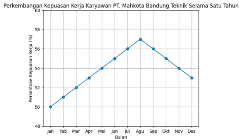
Grafik 1. Data Perkembangan Kepuasan Kerja Karyawan PT. Mahkota Bandung Teknik

Berdasarkan grafik perkembangan kepuasan kerja karyawan PT Mahkota Bandung Teknik selama satu tahun, tingkat kepuasan kerja berada pada kategori relatif rendah dan berfluktuasi. Kepuasan kerja meningkat dari 50% pada awal tahun hingga mencapai puncak 57% pada bulan Agustus, namun kemudian menurun kembali menjadi 53% pada bulan Desember. Kondisi ini menunjukkan bahwa peningkatan kepuasan kerja belum stabil dan mengidentifikasi masih adanya permasalahan internal, seperti dukungan organisasi dan lingkungan kerja yang belum optimal, sehingga diperlukan penelitian lebih lanjut untuk mengkaji faktor-faktor yang mempengaruhi kepuasan kerja karyawan.